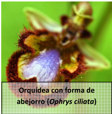
Orquídea con forma de abejorro ( Ophrys ciliata )

El término “coevolución” se utiliza cuando hay una relación estrecha entre los ciclos biológicos de dos especies distintas. La explicación clásica de este proceso implica una adaptación mutua de ambas especies de forma gradual. Es decir, cada una de las especies a lo largo de la Evolución cambiaría algún rasgo de su fenotipo y la otra especie se adaptaría a este cambio, todo ello de forma azarosa, de manera que al final una especie no podría vivir sin la otra, ya que sus ciclos de vida estarían ligados. El ejemplo más conocido de coevolución lo